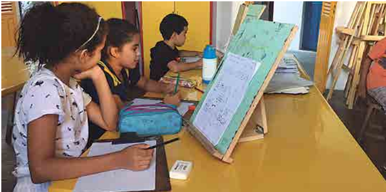
Alunos atendidos pelo Centro Estadual de Arte (Cearte) podem optar por diferentes expressões, a exemplo das artes plásticas, que oferece curso de desenho

Além da variação nos cursos de fotografia, outra novidade está na literatura. Os cursos estão voltados para quem quer aprender a