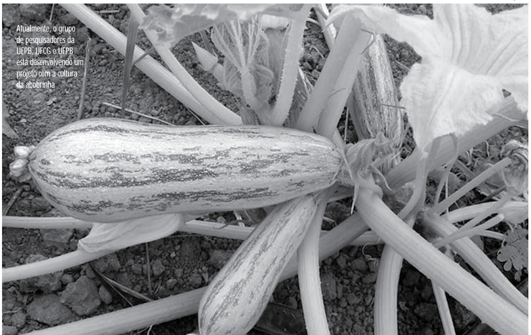
Atualmente, o grupo de pesquisadores da UEPB, UFCG e UFPB está desenvolvendo um projeto com a cultura da abobrinha

Apesar de fazer parte do Semiárido nordestino,