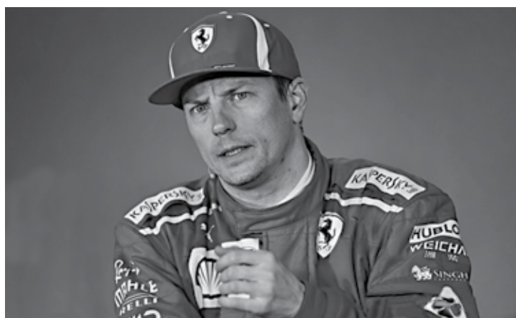
Finlandês aguarda uma definição da Ferrari para decidir o seu futuro

tar o quinto título mundial e o primeiro com a equipe de Maranello, o alemão respondeu: "Eu não sei. É muito cedo para prever isso.