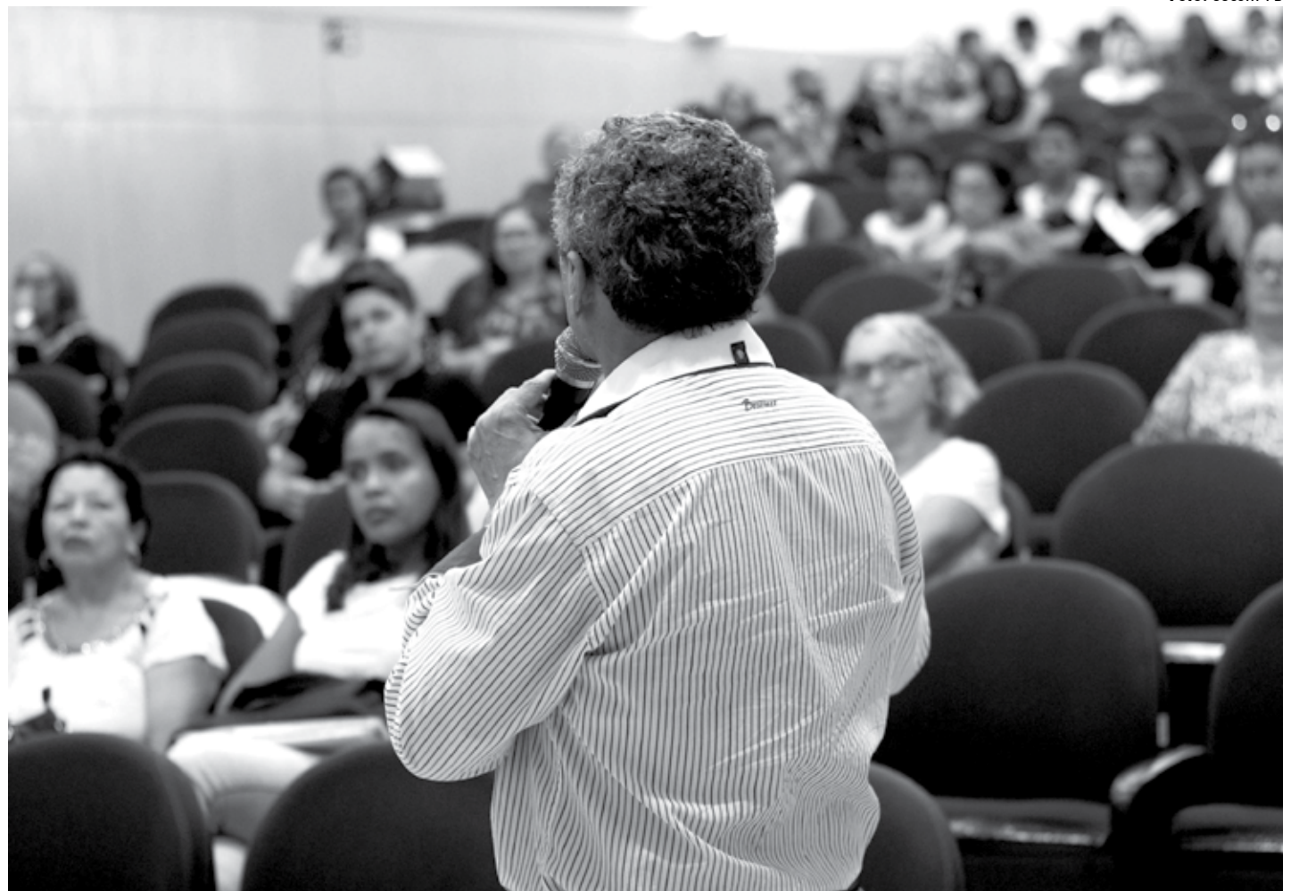
O objetivo da qualificação promovida pelo comitê é sensibilizar os professores da Rede Pública de Ensino para a prevenção e controle do tabagismo