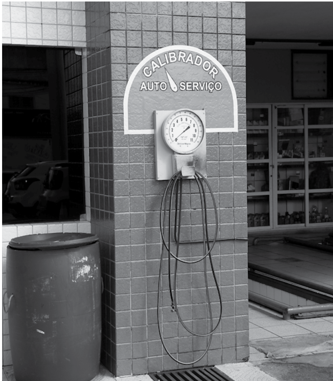
Equipamento deve estar em perfeitas condições de uso, em local de fácil acesso e disponibilizado gratuitamente