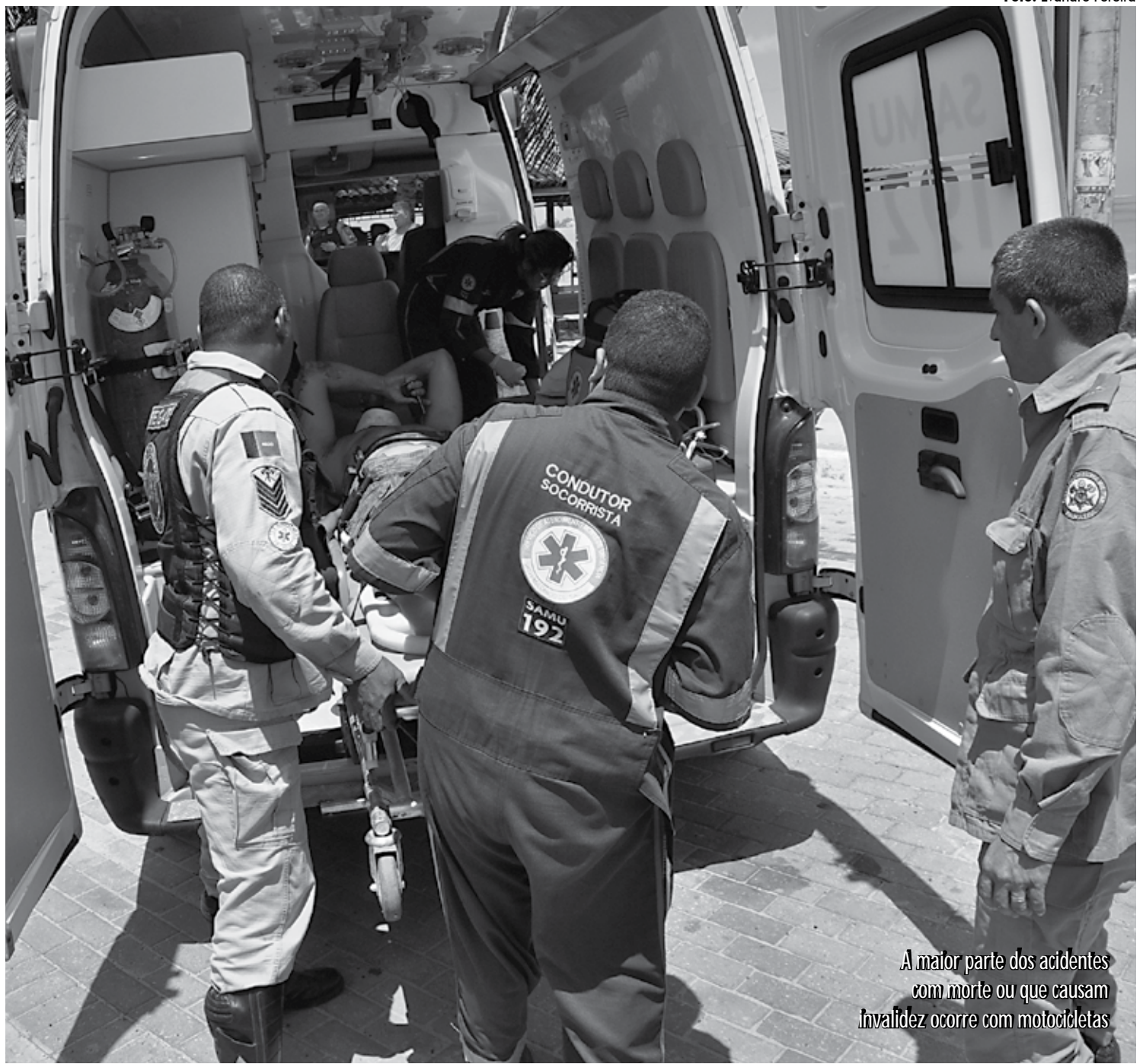
A maior parte dos acidentes com morte ou que causam invalidez ocorre com motocicletas

No ano passado, foram cerca de 384 mil indenizações pagas pelo DPVAT, das quais a maior parte foi para homens na faixa etária de 18 a 34 anos