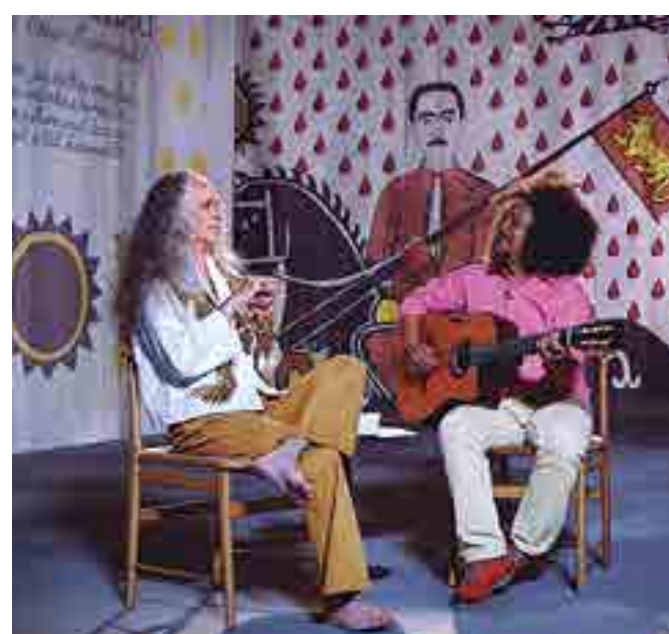
A apresentadora vai receber o cantor Chico César na segunda edição

Além de receber - como uma autêntica anfitriã - os seus convidados oriundos dos universos acadêmico e musical para entabular uma conversa informal sobre as obras das personalidades