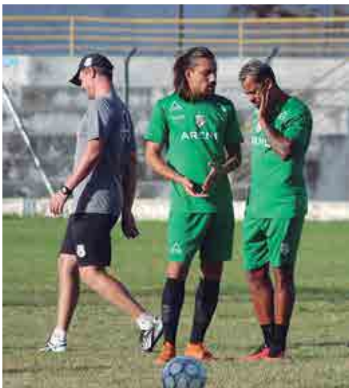
Jogadores conversam preocupados com o jogo da próxima segunda-feira