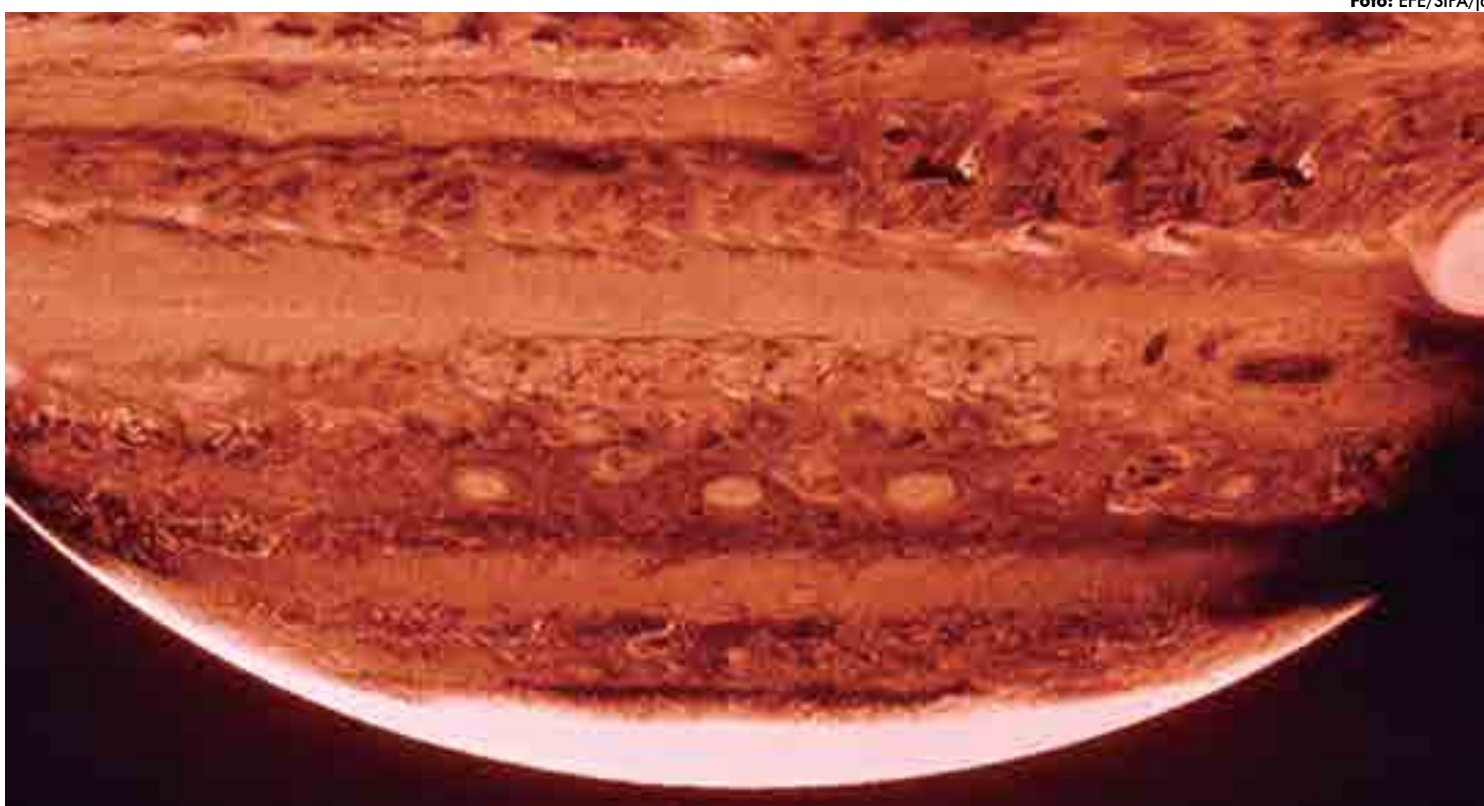
Júpiter agora é o planeta do Sistema Solar com mais satélites, com 79, depois que os astrônomos descobriram uma dúzia de novas luas orbitando-o

Nove das luas são parte de uma nuvem externa que orbita Júpiter em direção contrária à rotação do planeta, que le-