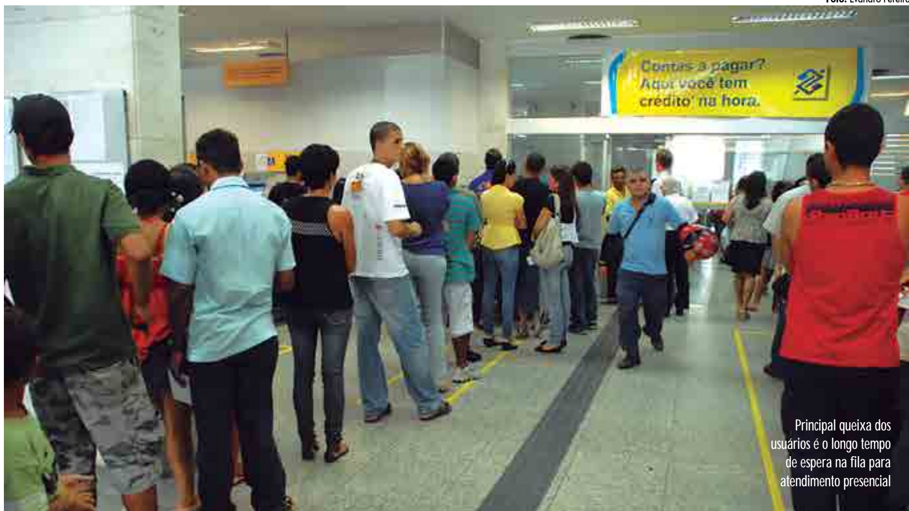
Principal queixa dos usuários é o longo tempo de espera na fila para atendimento presencial