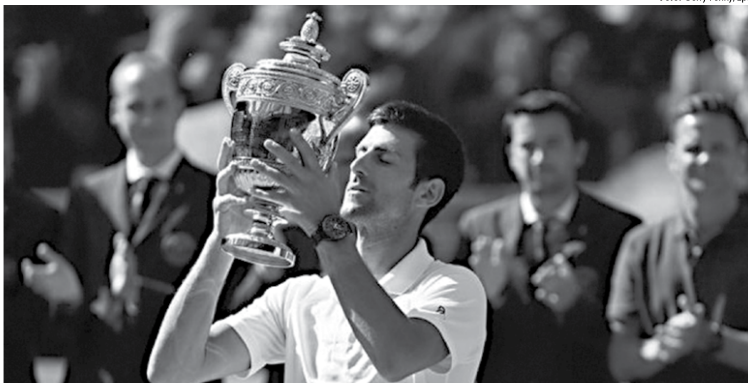
O sérvio Novak Djokovic ergue o troféu em Wimbledon e diz que, mesmo aos 31 anos, não tem data para deixar de fazer o que mais gosta na vida