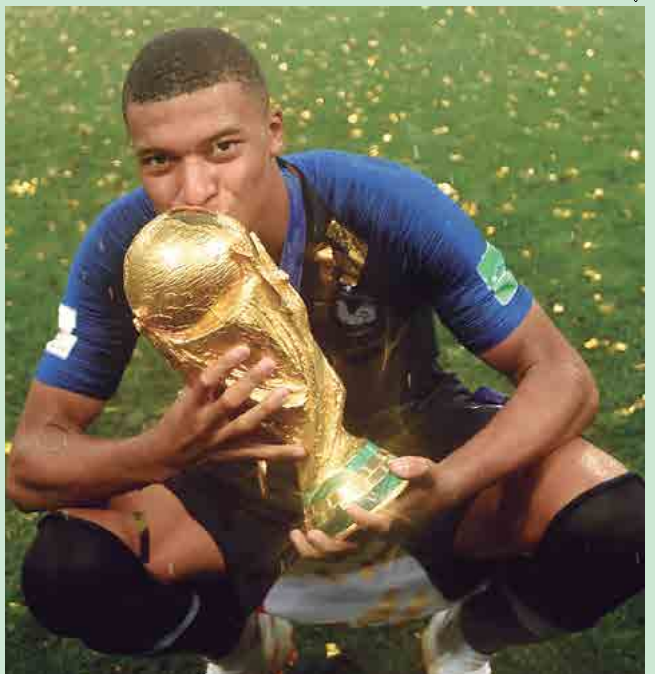
Escolhido como o melhor atleta jovem da Copa do Mundo da Rússia, Mbappé doou quase R$ 2 milhões a uma instituição de caridade

De acordo com o L'Equipe, a ação de Mbappé parece ter inspirado uma série de doações feitas pelos próprios jogadores da seleção francesa, que também repassaram seus ganhos em premiações da Copa para uma viagem educacional de 25 crianças do colégio Jean-Renoir para a Rússia.